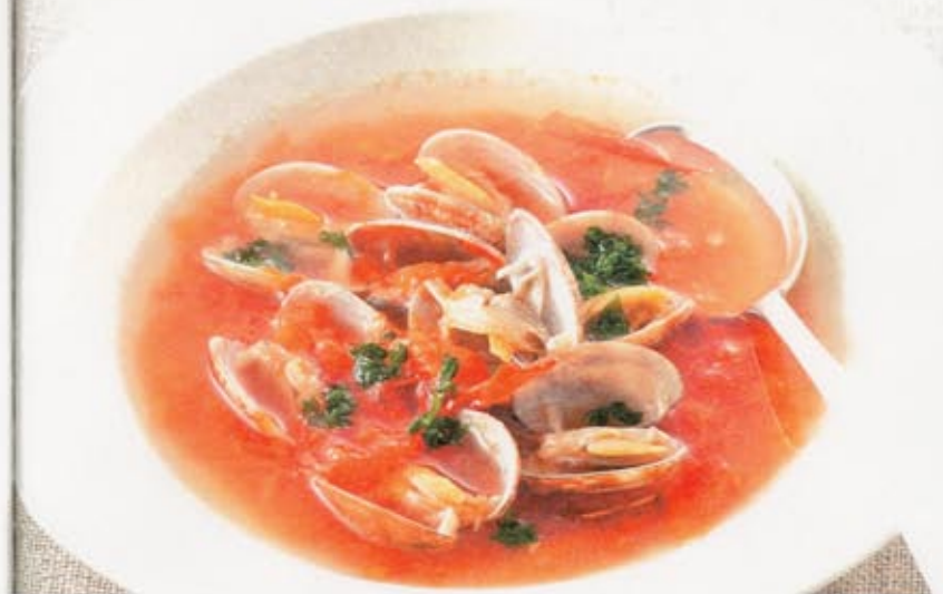
あさりとトマトのスープ