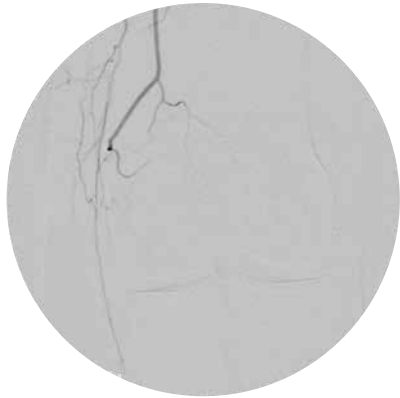
正常なひざの血管