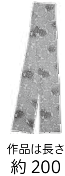
作品は長さ 約 200