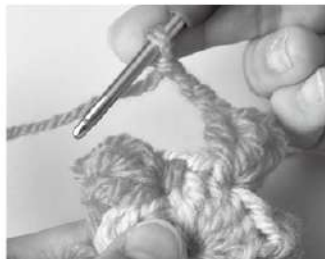
1 パブコーンを編んだらくさり編みをする。