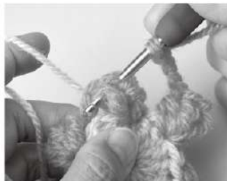
2 次に編む糸を持ち、パブコーンの頭に針を入れる。