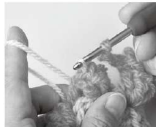
3 針に糸をかけ、引き抜く。