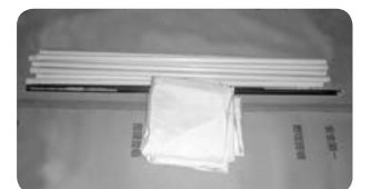
使用後の片付け状況