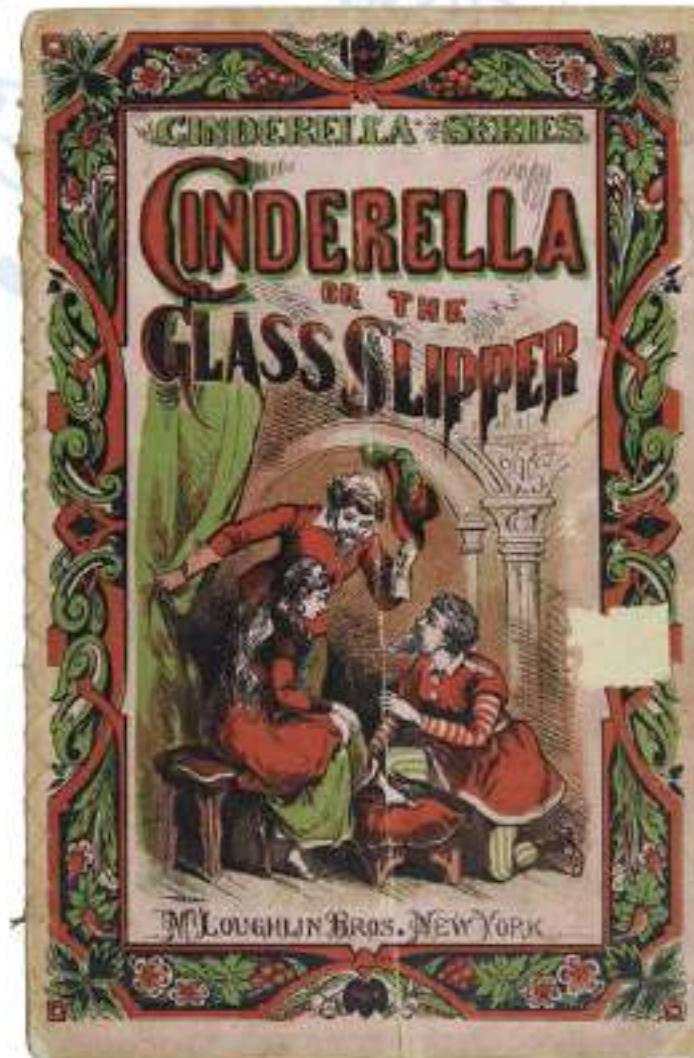
2-034 【シンデレラ、あるいはガラスの靴】 マクローリン・ブラザーズ社/アメ リカ/1880年代