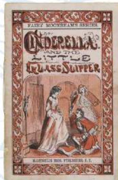
2-030 【シンデレラと小さなガラスの靴】 マクローリン・ブラザーズ社/アメ リカ/1870年