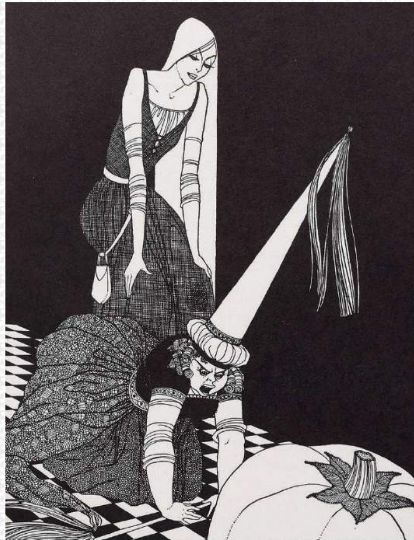
2-046 『靴を履いたシンデレラ』 絵：マック・ハーシュバーガー/アメリカ/1936年

ジャズ・エイジを中心に活躍したアメリカの画家マック・ハーシュバーガーが描いた、ジャズ・エイジ風のシンデレラ絵本。洒落でユーモアに富んだパロディになっており、コルセットを用いないハイウエストのドレスなど、シンデレラの衣装もアール・デコの影響が色濃く出ている。シンデレラの一人称で物語が進行するあたりも、女性の存在が大きく変化したジャズ・エイジらしいところ。