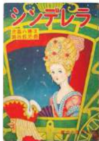
2-090 『シンデレラ』文：北島八朗/画：藤谷虹児/文芸堂出版/1953年

ふっくらしたほっぺにおちよぼ口と、日本の幼い子どもをイメージして描かれたシンデレラ。王子様も、リリしいというより、かわいらしく描かれている。