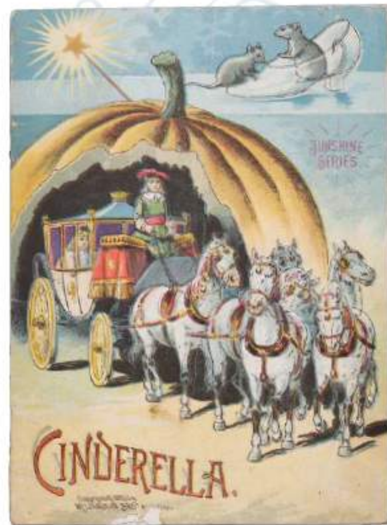
2-033 【シンデレラ】マクローリン・ブラザー ズ社/アメリカ/1893年