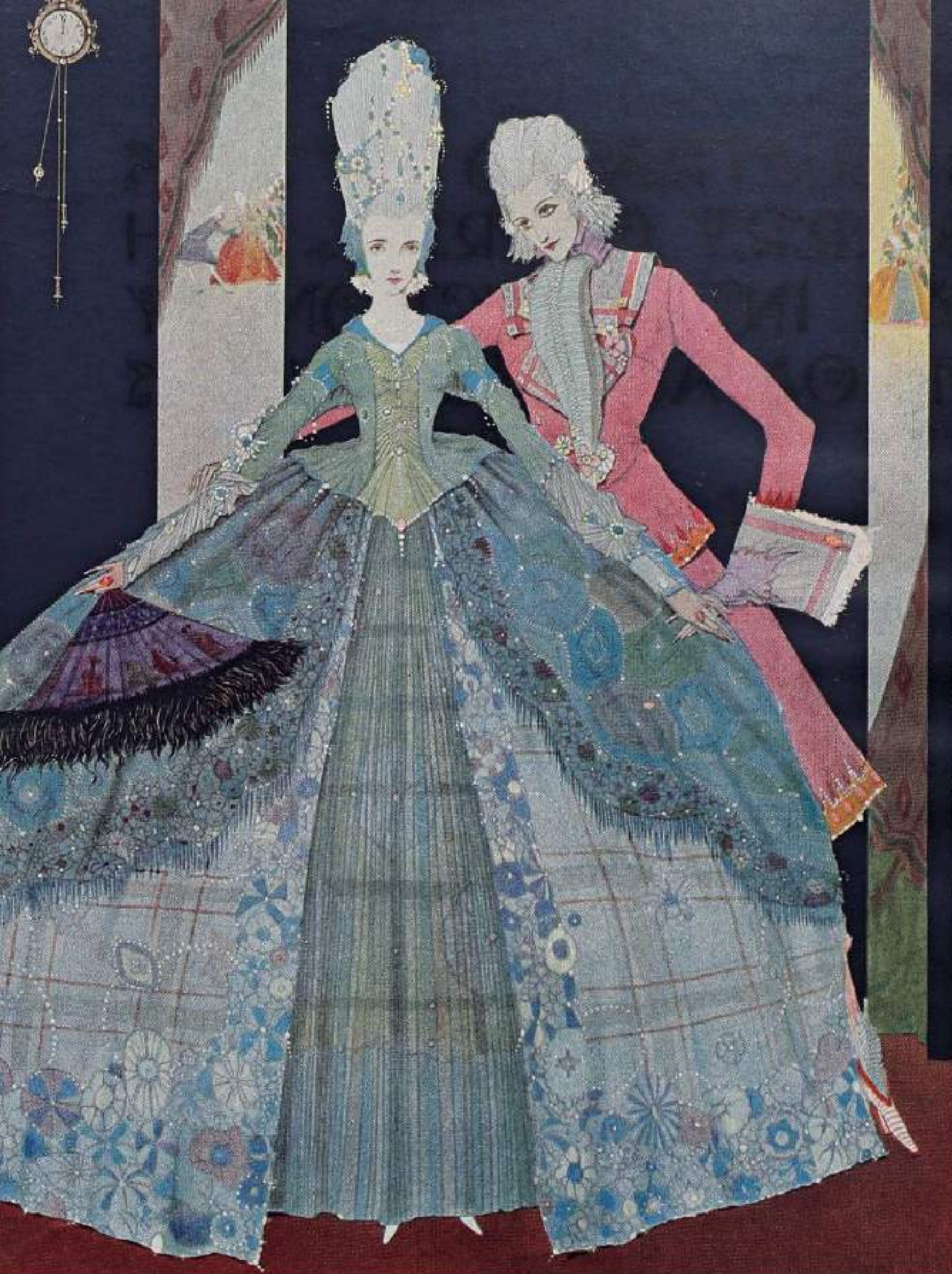
2-013 『ペロの女とぎ話』 ハリー・タラター/イギリス/1923年