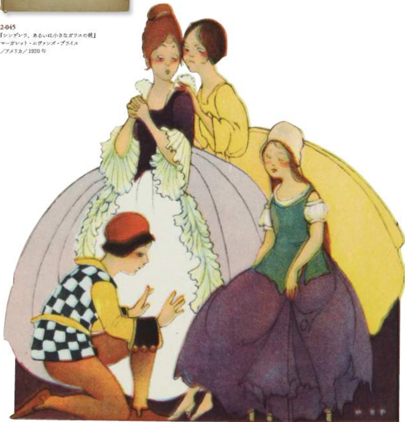
2-045 『シンデレラ、あるいは小さなガラスの靴』 マーガレット・エヴァンズ・プライス アメリカ/1920年

マーガレット・エヴァンズ・プライスは、1930年に夫であるアーヴィング・プライスとヘルマン・フィッシャーと共に玩具メーカー「フィッシャー・プライス・トイズ」を創設。同社の最初のアートディレクターとなり、自身の絵本キャラクターを使ったおもちゃのデザインをした。