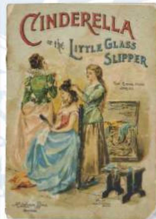
2-032 【シンデレラ、あるいは小さなガラ スの靴】マクローリン・ブラザーズ 社/アメリカ/1897年