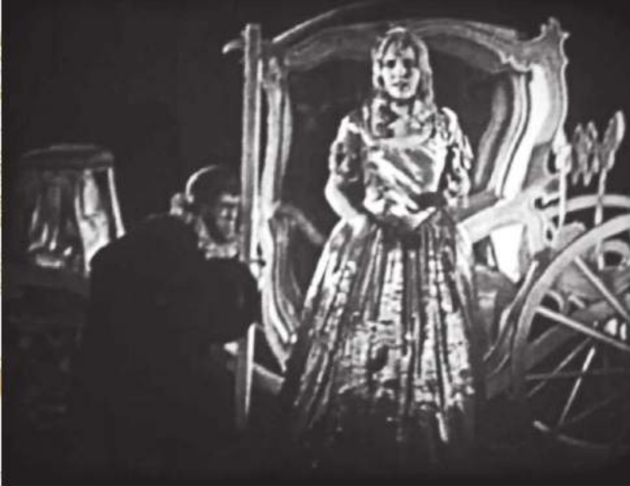
4-042 映画フィルム/ ドイツ/1933年

1938年に公開された「Cinderella meets fella」のフィルム。テックス・アヴェリーによる短編アニメーション。