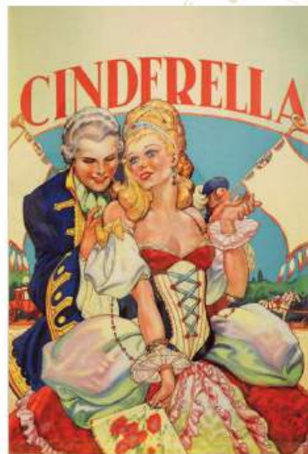
4-011 ポスター/イギリス/1930年代

GRAND OPERA HOUSE BELFAST Proprietors: WARREN LTD. Telephone: 22903