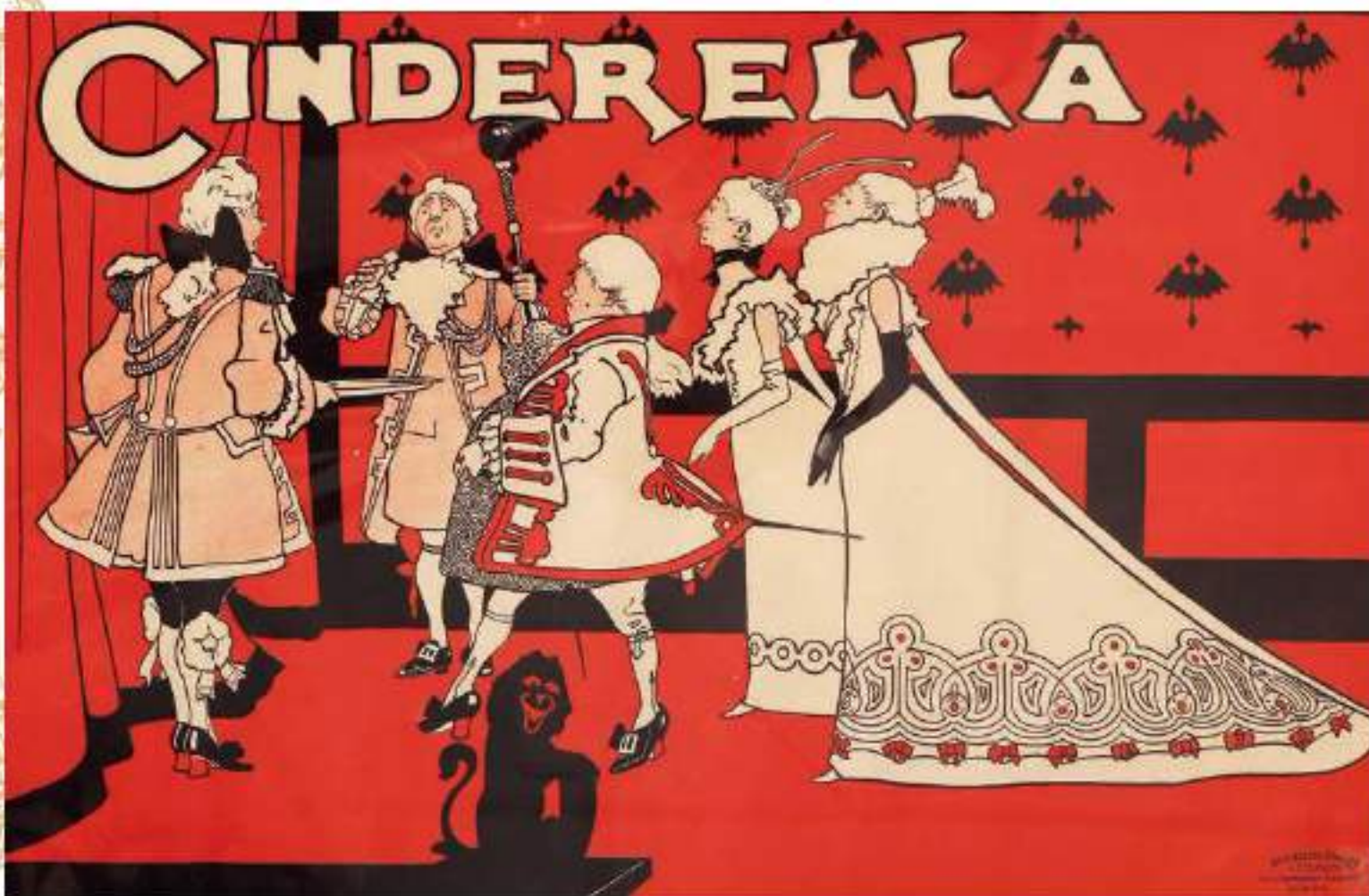
4-007 ポスター/ノッティンガムシアター/イギリス/1897年

日本でも、新宿コマ劇場が存在した時代に、夏休みの家族向け作品として、1995年から2008年まで6度公演されました。