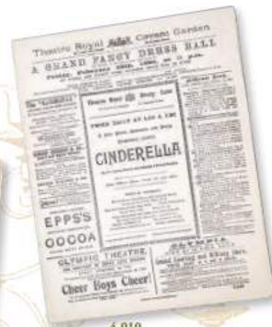
4-010 パンフレット/シアター・ロイヤル劇場 (現：ロイヤル・オペラハウス) / イギリス/1896年