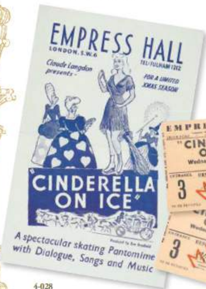
4-028 プログラムとチケット/アメリカ/1952年

1981年には、『ディズニー・オン・アイス』がスタートしました。スケーターがディズニーキャラクターに扮して、ディズニーの物語や音楽を表現する内容が人気を集め、日本でも1986年から開催されています。公演内容により、シンデレラもプリンセスの1人として登場します。