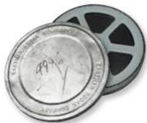
4-041 映画フィルム /アメリカ/1938年

1938年に公開された「Cinderella meets fella」のフィルム。テックス・アヴェリーによる短編アニメーション。