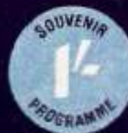
4-030 プログラム /イギリス/1956~57年